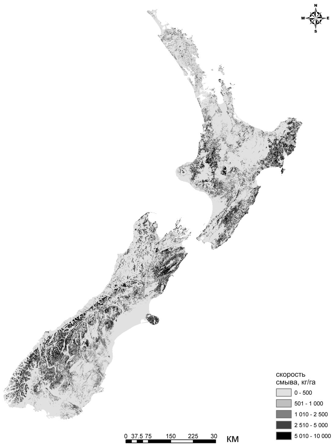
Рис.1. Распределение эрозионного смыва со склонов по территории Новой Зеландии (рассчитано с помощью Универсального уравнения почвенного смыва).